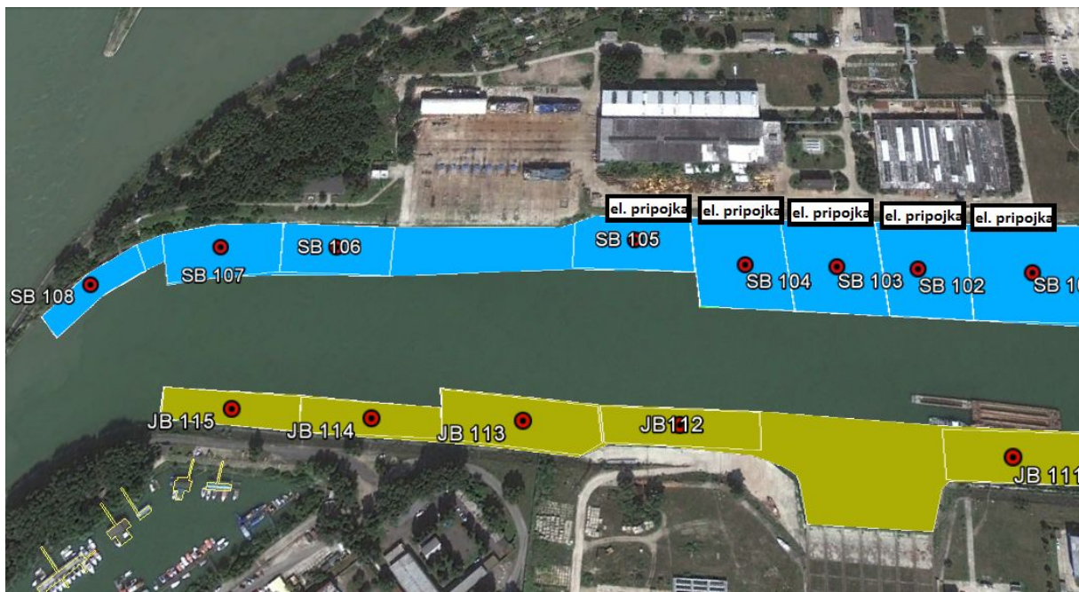
bazén Lodenica (NOL)